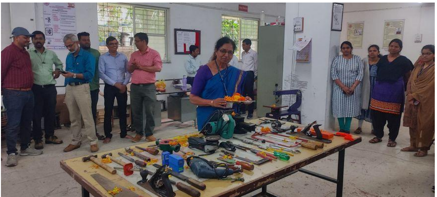
Dassehara Pooja at workshop