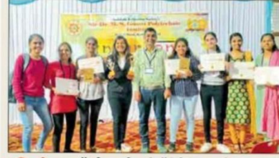
नाशिक रोड : सर डॉ. मो. स. गोसावी पॉलिटेक्निकमध्ये विविध स्पर्धेतील विजेते.