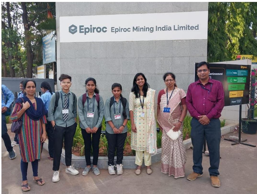
Scholarship of Rs. 25000/- offered by Epiroc Mining Co. India Ltd. Nashik