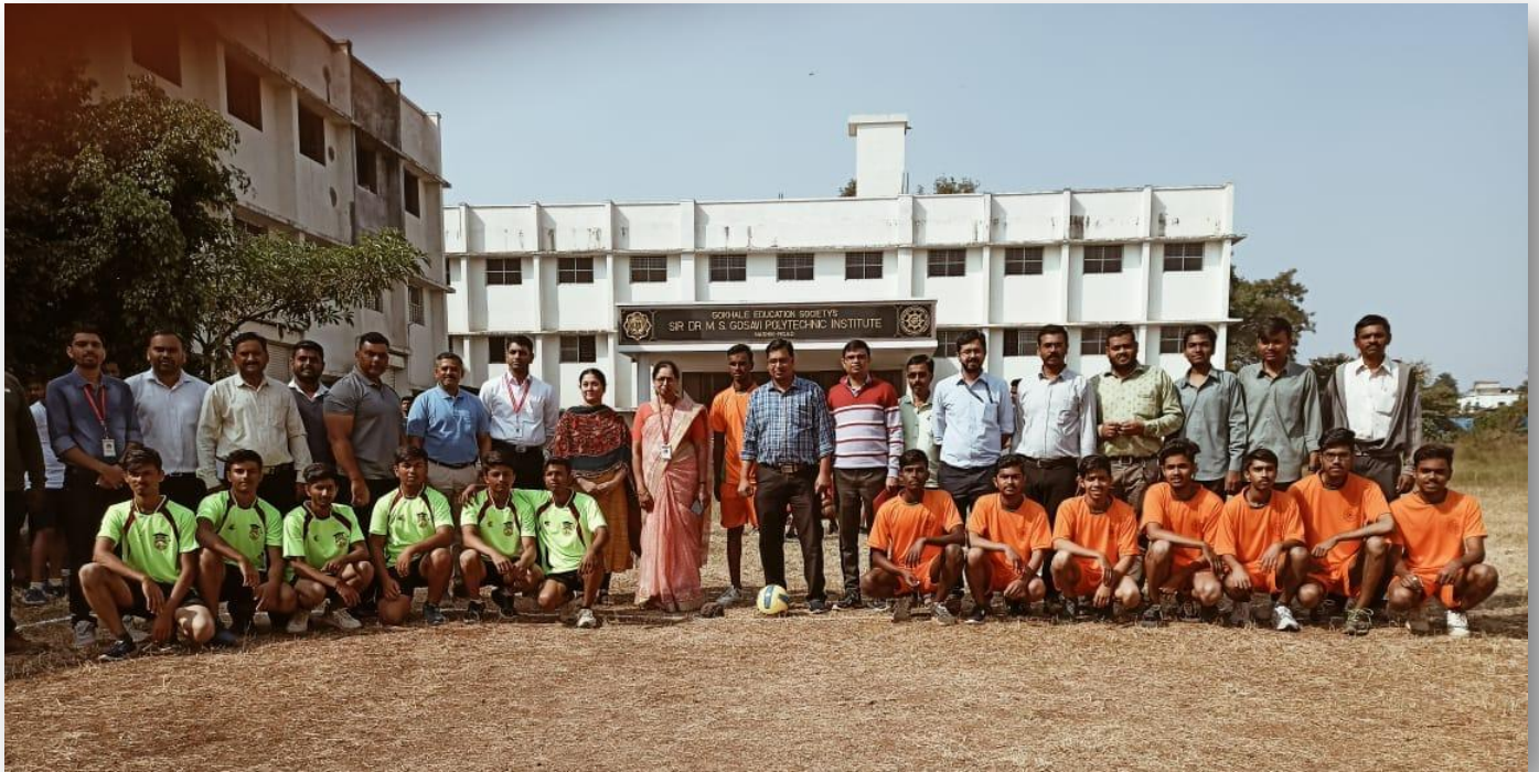
IEDDSA- Volley Ball Matches