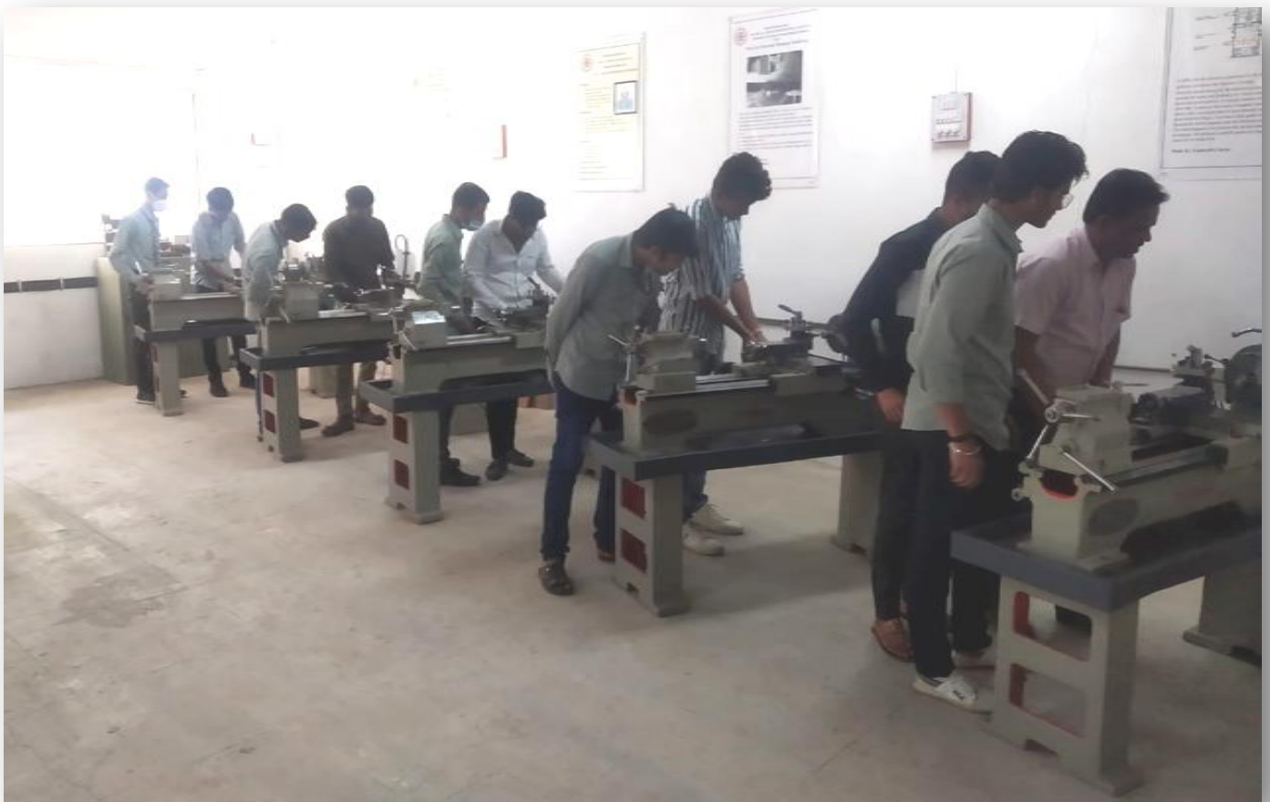
Students doing practical on lathe Machine at Workshop