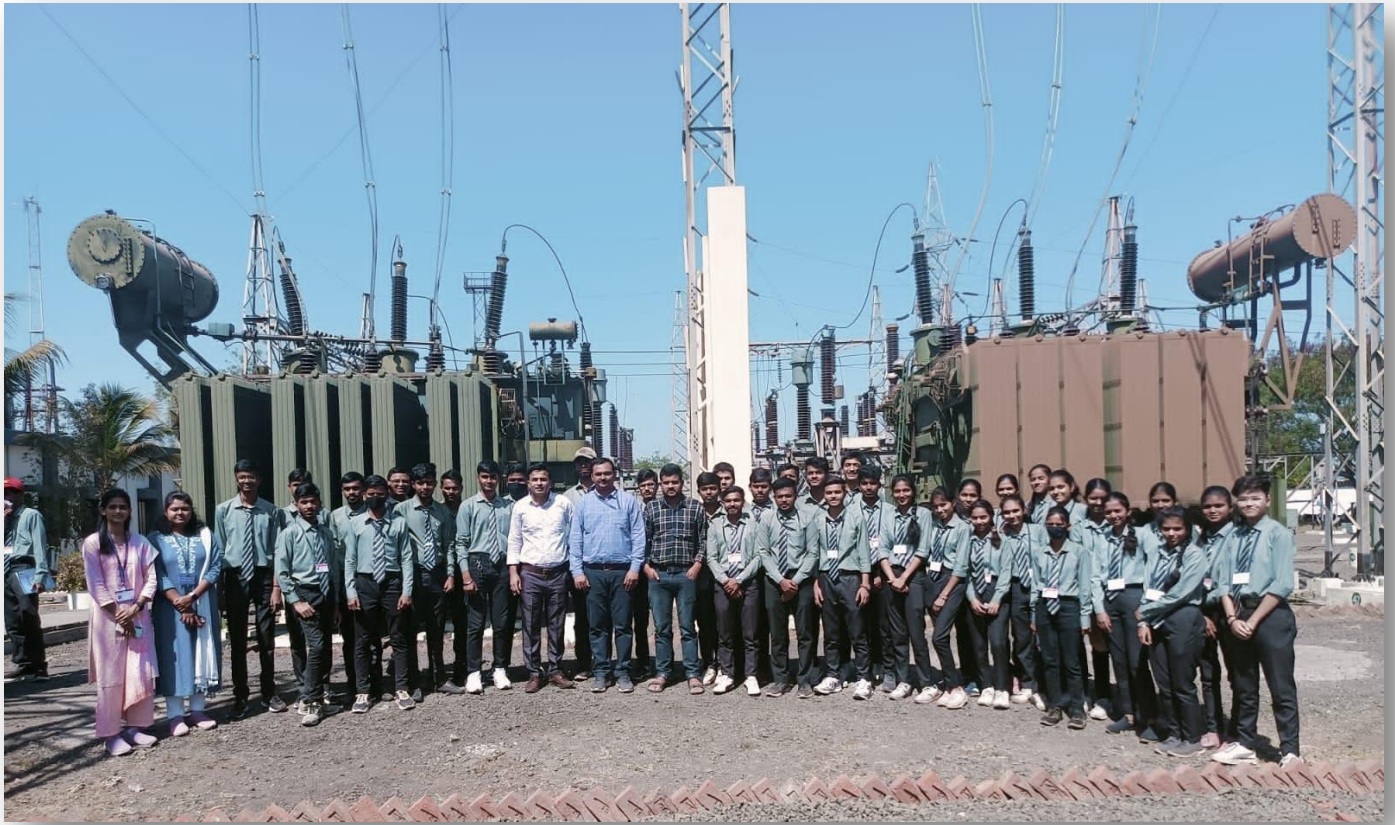
Industrial Visit at 132 KV Takali Road